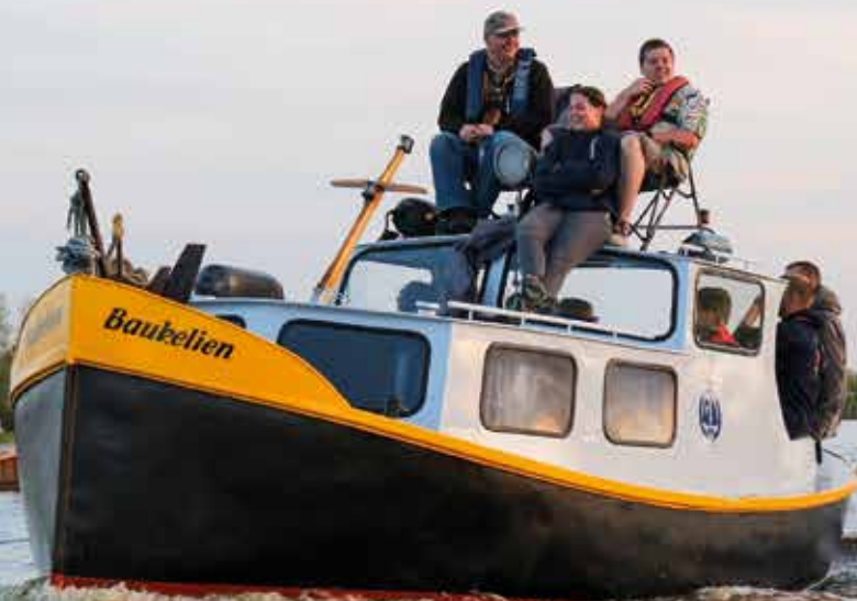
De huidige Baukelien

Voor de bouw van 'Baukelien II' staat een bedrag begroot van ruim € 70,000,- euro. Helaas is dit bedrag hoger dan onze Scoutinggroep op dit moment kan opbrengen. Ondanks dat een deel van deze kosten al worden gedekt door onze eigen inbreng (10k), een bijdrage van OBW Sneek en de opbrengst van diverse ledenacties willen we een beroep doen op verschillende fondsen en (Sneker) bedrijven. De eerste contacten zijn al gelegd, waardoor we nu al de helft van ons gewenste bedrag hebben gerealiseerd. Door de gevolgen van covid-19 is niet elk bedrijf in de gelegenheid om ons financieel te steunen. Door sponsoring in natura willen we de totaalkosten naar beneden brengen. Hierdoor willen we de samenwerking met (lokale) bedrijven vergroten en de maatschappelijk waarde voor waterscouting én praktijkonderwijs benadrukken. Door sponsoring in natura is het voor ons mogelijk om exact bij te houden wat er door welk bedrijf is gesponsord. In ruil hiervoor kunnen wij bijvoorbeeld uw logo op onze website zetten, een nieuwsbericht plaatsen op onze (sociale) media kanalen, uw bedrijf uitlichten in ons clubblad of, voor hen die ons het meest helpen, eventueel zelfs zichtbaar terug te laten komen op het nieuwe schip.